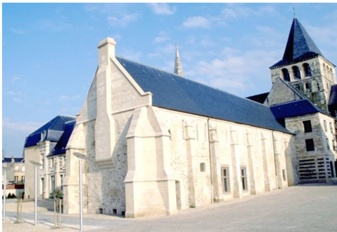
Aile est du XIII ème : Réfectoire et dortoir

L'abbaye féminine et bénédictine de Montivilliers est une des fondations majeures de la Normandie monastique. Entre 1989 et 2000 ses bâtiments conventuels ont fait l'objet d'une totale restauration et accueillent un Parcours-spectacle « Cœur d'Abbayes ».