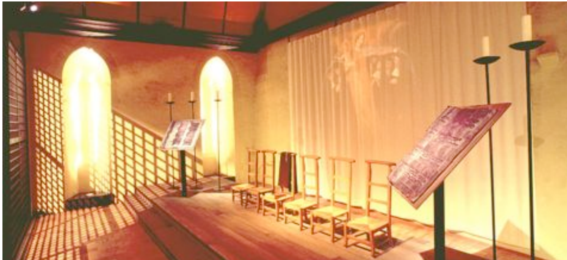
L'abbatit de Louise de l'Hospital

10 espaces successifs présentent la prestigieuse histoire de l'abbaye et de la cité au fil de l'histoire de France et de la Normandie.